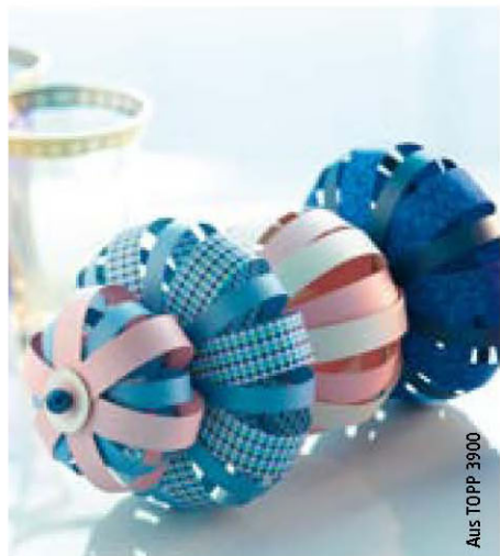
Aus TOPP 3900