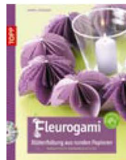
TOPP 3881 € (D) 7,90 Kreativ-Softcover, 32 Seiten, 17 x 22 cm, Umschlagklappen, mit DVD ISBN 978-3-7724-3881-3