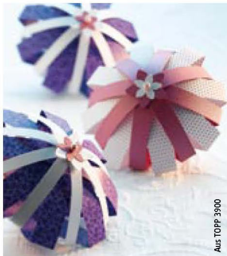
Aus TOPP 3900