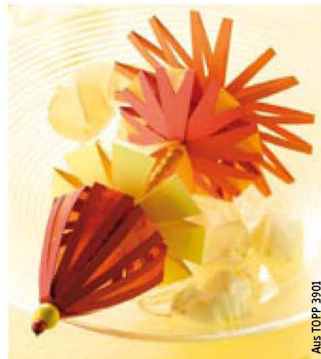
Aus TOPP 3901

Papier ist ein so vielseitiges Material, wie kaum ein anderes. Weiß oder bunt, uni oder gemustert, dick oder dünn. Papier zerreißt schnell in unseren Händen, schafft es aber auch uns